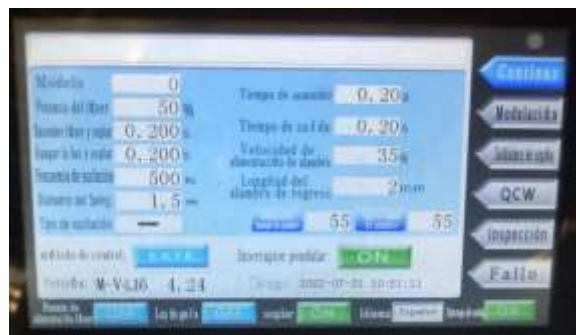
Panel de control en castellano