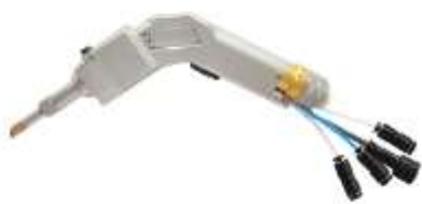
Cabezal de soldadura láser con 10m de antorcha