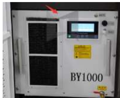
Refrigerador del resonador