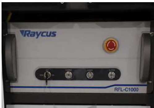
Resonador láser fibra Raycus